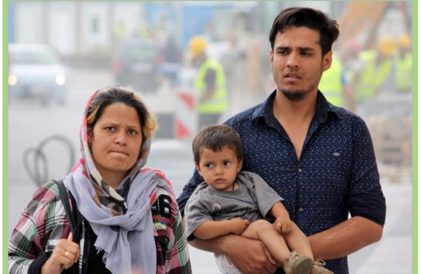
Familien sind auf der Balkanroute unter schwierigen Bedingungen auf der Flucht.

Letzten Sommer bereiste ich als privilegierter Schweizer ohne Zollschikanen die Balkanregion. Was ich sonst nur aus den Medien kannte, wurde auf einen Schlag dramatische Realität. Die Folgen des Versagens der europäischen Gemeinschaft, die sich gerne aufgeklärt und humanistisch schimpft, waren erschreckend.