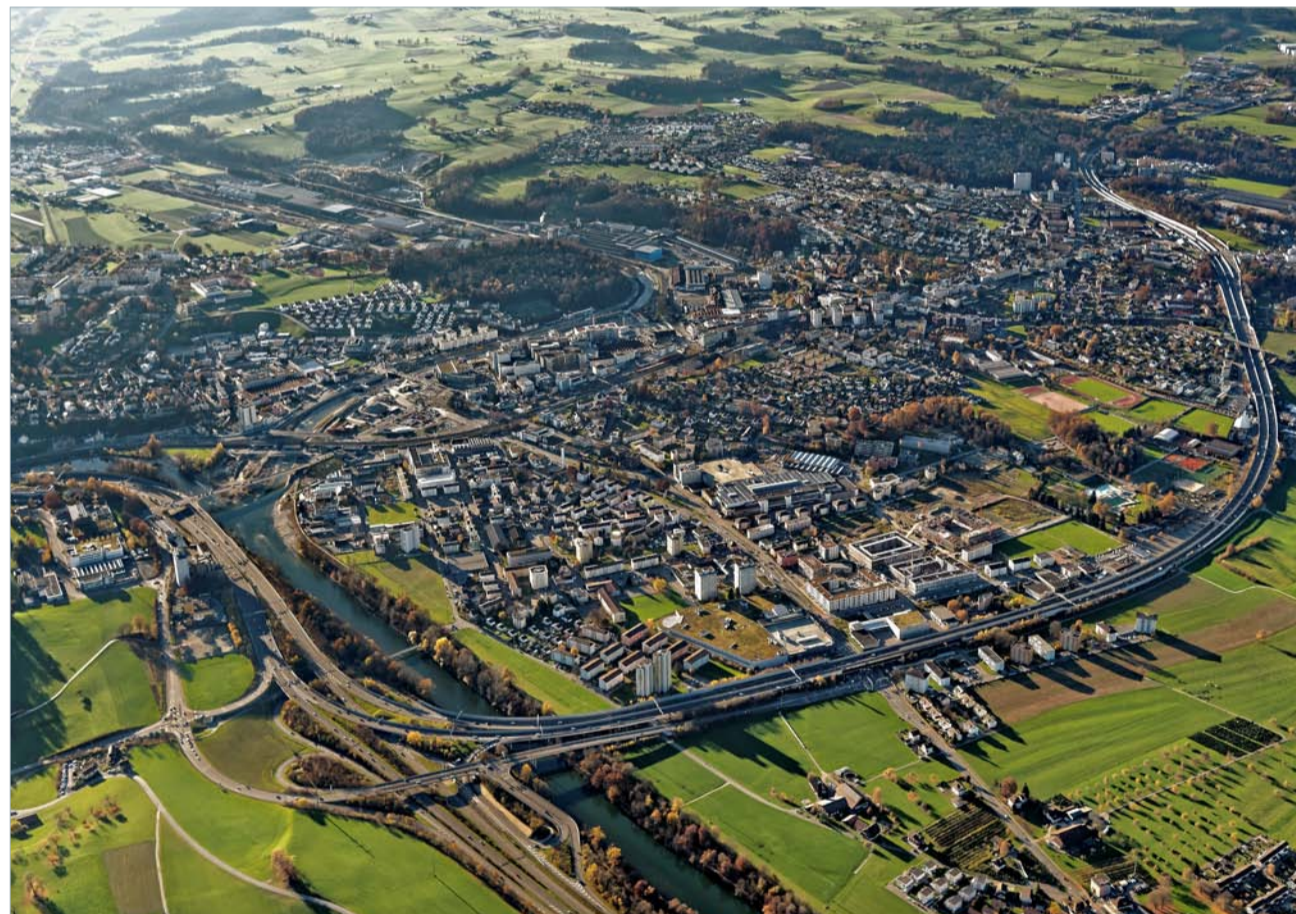
Luftaufnahme der Gemeinde Emmen

Mit eigenem Land hat die Gemeinde Möglichkeiten direkten Einfluss auf die Entwicklung und Veränderung in der Gemeinde zu nehmen. Zukünftige Generationen werden dankbar sein, wenn die Gemeinde dann noch eigenes