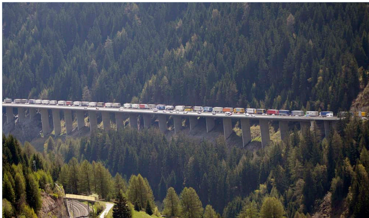
Der Brenner ist durchgehend vierspurig und erstickt in der Lastwagenlawine – er hat mehr als doppelt so viele Lastwagen pro Jahr zu verkraften wie der Gotthard.