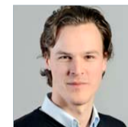
Bastien Girod, Vizepräsident Grüne Schweiz, Nationalrat ZH, Mitglied UREK

Die sechs TWh, die Beznau I und II produzieren, liessen sich einfach durch erneuerbare Energien ersetzen. Schon nur mit einer Verdopplung des Zubaus, den wir bereits 2013 erlebt hatten, würde bis 2020 6.5 TWh mit neuen erneuerbaren Energien produziert. Erfahrungen im Ausland zeigen, dass auch ein noch grösserer Zubau problemlos möglich wäre. Schliesslich haben wir in Europa nicht einen Mangel, sondern eine Überproduktion an Strom. Deshalb würde das Abstellen der AKWs auch den Markt beruhigen, wovon zum Beispiel auch die Schweizer Wasserkraft profitieren würde.