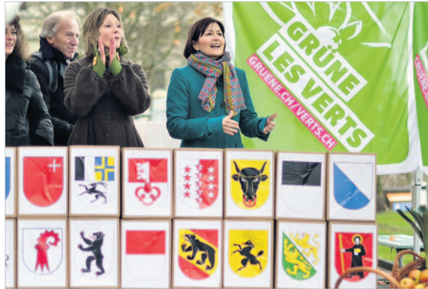
Regula Rytz bei der Einreichung der Fair-Food-Initiative im November 2015. www.fair-food.ch

Für mehr Qualität auf dem Teller Der sorglose Umgang mit Lebensmitteln und Rohstoffen zeigt, dass sich viele Menschen nicht bewusst sind, wie viel Wasser, Energie und Umweltzerstörung in unseren Alltagsprodukten stecken. Mit der «Fair-Food»-Initiative wollen die Grünen das Problem an der Wurzel packen. Die nationale Volksinitiative hat vier Verbesserungen zum Ziel: Nachhaltig produzierte Lebensmittel: Produkte aus bäuerlicher Landwirt-