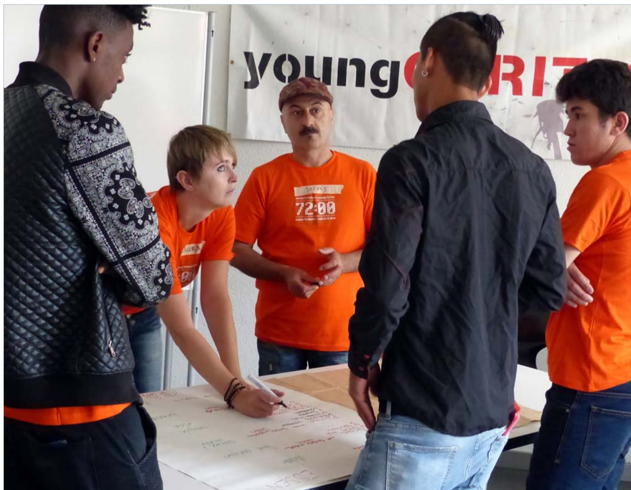
Bewohner des Asylzentrums Hirschpark im Gespräch mit Engagierten der Aktion 72-Stunden.

Schon bevor das Asylzentrum Hirschpark eröffnet wurde, haben sich die Bewohnerinnen und Bewohner des St. Karliquartiers wohlwollend auf die neuen Gäste eingestellt. Gezeigt hat sich dies sehr eindrücklich an der Informationsveranstaltung des Kantons im Pfarreizentrum St. Karl. Nun gehören die mehr als 100 Asylbewerber und Flüchtlinge genauso zum Quartierbild wie die Menschen aus 76 Na-