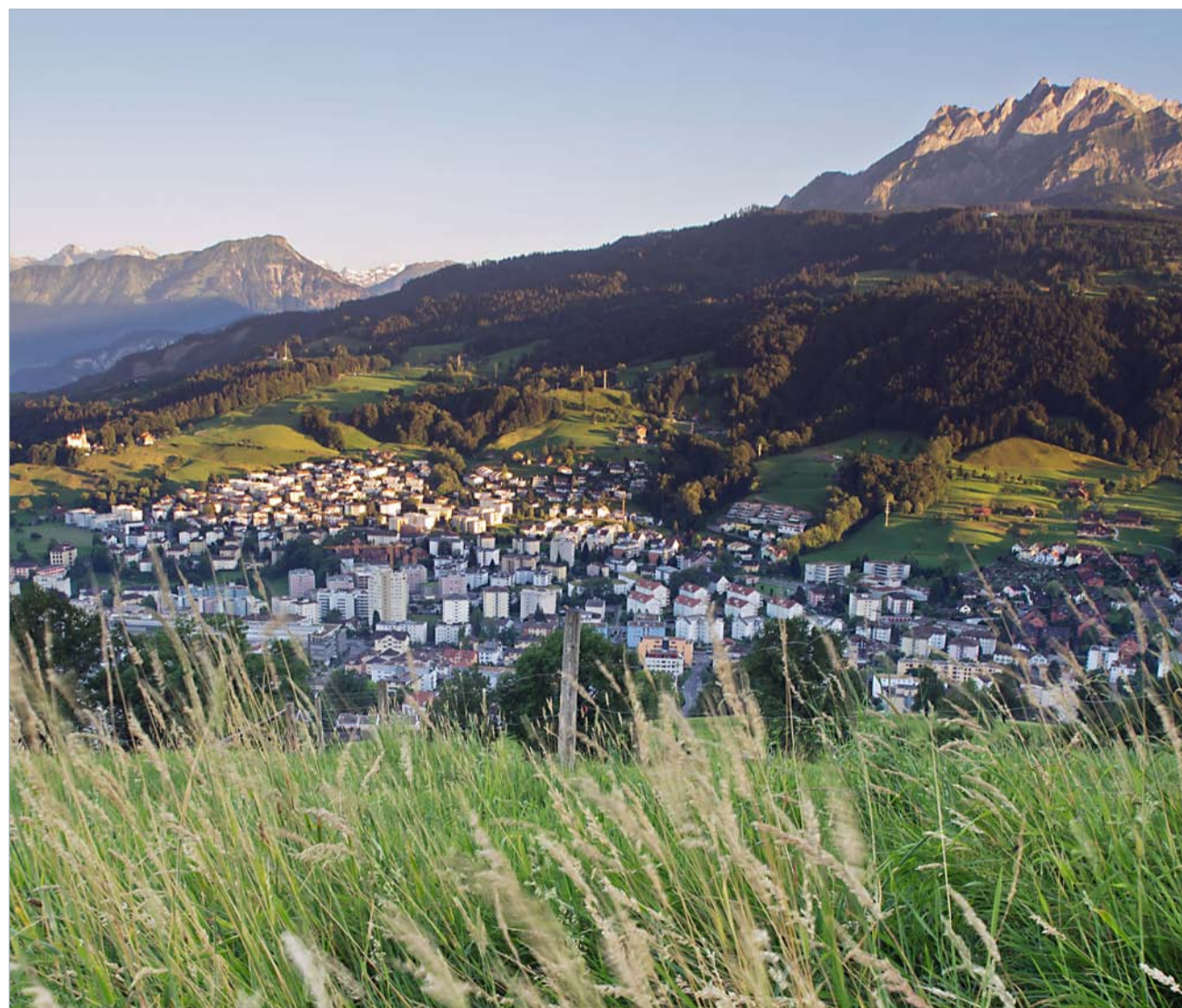
Die Grünen engagieren sich für den Schutz der Umwelt und die Verbesserung der Lebensqualität in der Gemeinde.

Die Aufenthaltsqualität an der Luzernerstrasse und auf dem Dorfplatz kann gesteigert werden: Lebendige Boulevard-Cafés und Gartenrestaurants sowie eine bessere Durchmischung von