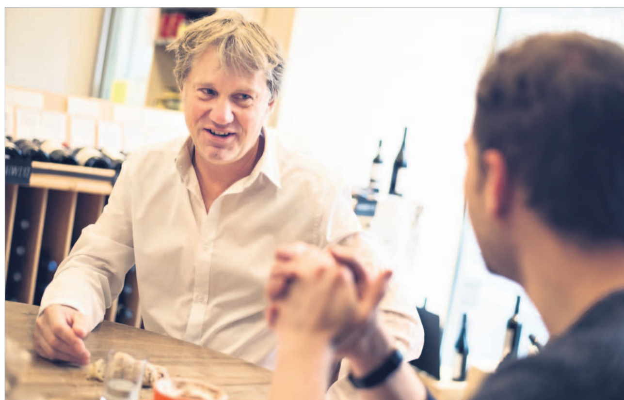
«Ich spüre, dass sich viele Krienserinnen und Krienser eine Integrationsfigur wünschen. Diese Rolle nehme ich gerne an.»

1988 hast du den Velociped eröffnet – du bewegst Kriens wortwörtlich seit Jahrzehnten. Ist es das gleiche Kriens wie vor 26 Jahren?