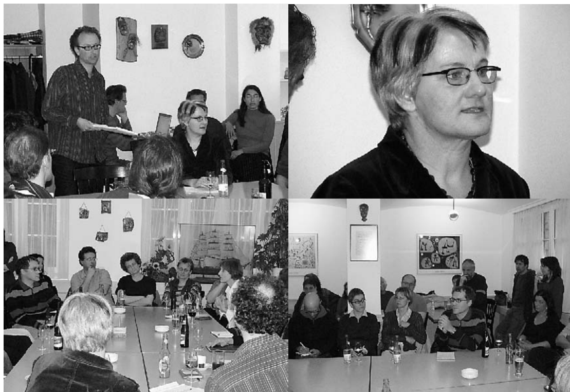
Nominationsversammlung zum 2. Wahlgang der Regierungsratswahlen vom 3. Mai 2007 im Hotel Anker.