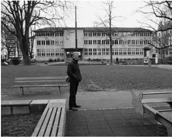
Vögeligärtli mit Zentral und Hochschulbibliothek

zur Lukaskirche, in eines der Lokale rund um den Platz, und selbst im Winter toben sich Kinder auf dem Spielplatz aus. Hier ist bereits spürbar, was an der Industriestrasse verwirklicht werden könnte: Ein lebendiger Quartierkern, spürbar durchmischte Nutzung.