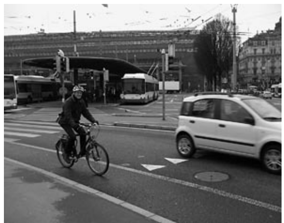
Seebrücke, linkes Ufer