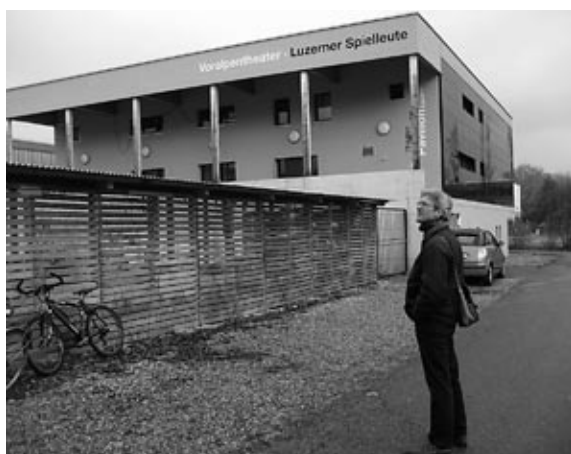
Theaterpavillon am Spelteriniweg