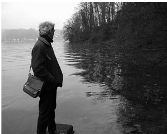
Bucht beim Tribtschenhorn