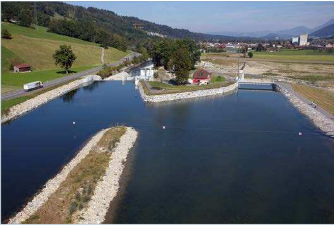
Kraftwerk Ettisbühl, Malters

Am 21. Mai stimmt das Schweizer Volk über die Energiestrategie 2050 ab. Die Vorlage wird von Bundesrat, National- und Ständerat unterstützt. CVP, BDP, EVP, GLP, SP, FDP und die stehen hinter der Vorlage. Auch die Umwelt-, Landschafts-, Heimat- und Naturschutzorganisationen haben sich dafür ausgesprochen. Es ist eine wichtige Abstimmung, die über unsere Energiezukunft bestimmen wird.