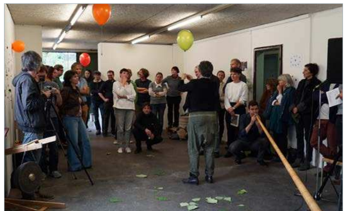
Bilder: Antonia Meile