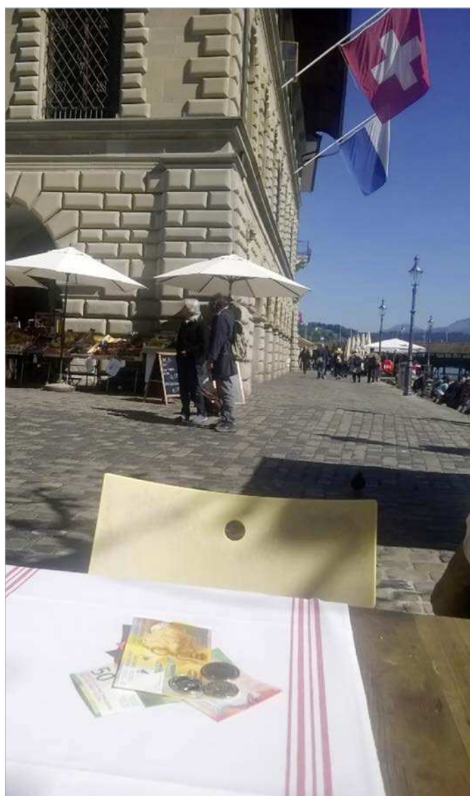
«Rechnungslegung» vor dem Luzerner Rathaus nach dem Mittagessen

Bei der Vorlage zum harmonisierten Rechnungsmodell 2 (HRM2) geht es um eine komplexe Kiste, die Auswirkungen auf die Finanzpolitik der Stadt Luzern