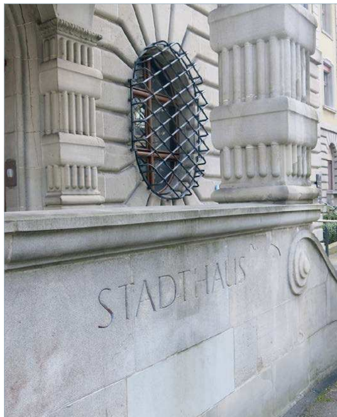
Akten aus dem Stadthaus müssen in Zukunft der Öffentlichkeit zugänglich gemacht werden.

Korintha Bärtsch forderte den Stadtrat in einer Interpellation mit 21 kritischen Fragen zur Spange Nord und der Hauptfrage, warum der Stadtrat weiterhin das System Bypass/Spange Nord unterstützt. Zwar stellt der Stadtrat Bedingungen, der Nutzen der Spange Nord für den Verkehr kann bisher kaum erklärt werden. Sie würde höchstens ermöglichen, zusätzlichen Verkehr auf der Autobahn zu schaffen, damit der Bund den Bypass-Ausbau der Autobahn auf die geplanten 10(!) Spuren rechtfertigen kann.