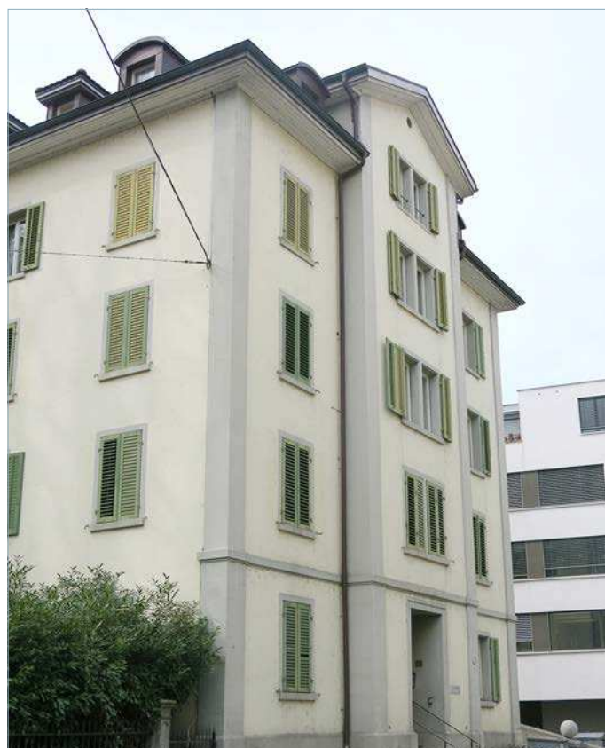
Die Notschlafstelle an der Gibraltarstrasse öffnet erst um 20 Uhr, vorher besteht vor allem im Winter eine Lücke bei der Infrastruktur für Leute auf der Gasse.

Christian Hochstrasser Grossstadtrat Luzern