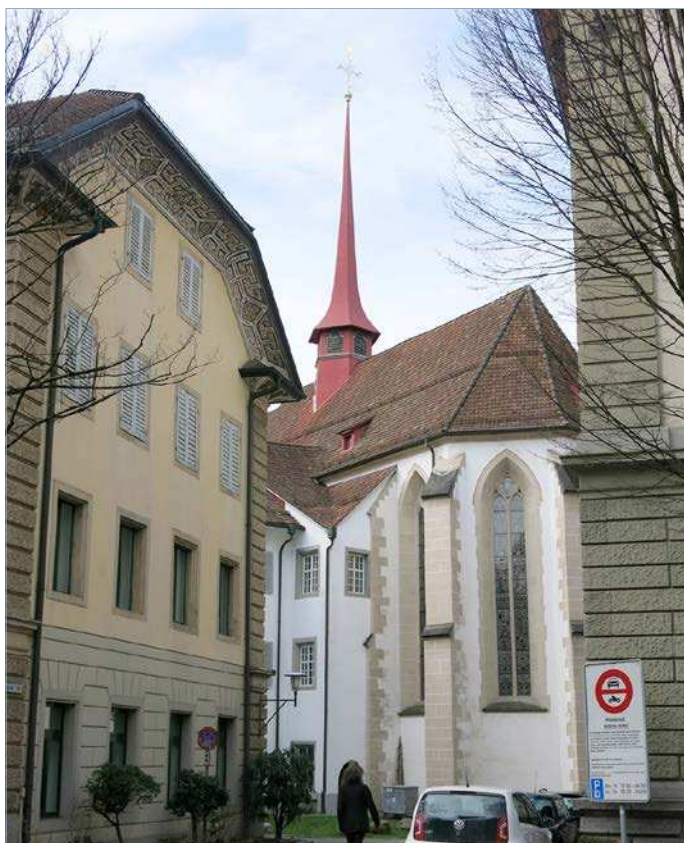
Für Kulturgüter wie die Franziskanerkirche fehlen diverse Notfallpläne für Brandfälle.