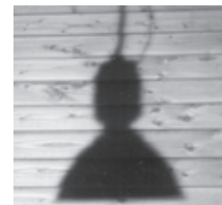
LICHT WIRFT SCHATTEN BAUKULTUR. WIRFT VERANTWORTUNG