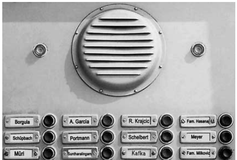
Wer ist denn da Schweizer oder Schweizerin?