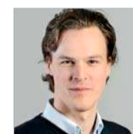
Bastien Girod, Vizepräsident Grüne Schweiz, Nationalrat ZH, Mitglied UREK

Die sechs TWh, die Beznau I und II produzieren, liessen sich einfach durch erneuerbare Energien ersetzen. Schon nur mit einer Verdopplung des Zubaus, den wir bereits 2013 erlebt hatten, würde bis 2020 6.5 TWh mit neuen erneuerbaren Energien produziert. Erfahrungen im Ausland zeigen, dass auch ein noch grösserer Zubau problemlos möglich wäre. Schliesslich haben wir in Europa nicht einen Mangel, sondern eine Überproduktion an Strom. Deshalb würde das Abstellen der AKWs auch den Markt beruhigen, wovon zum Beispiel auch die Schweizer Wasserkraft profitieren würde.