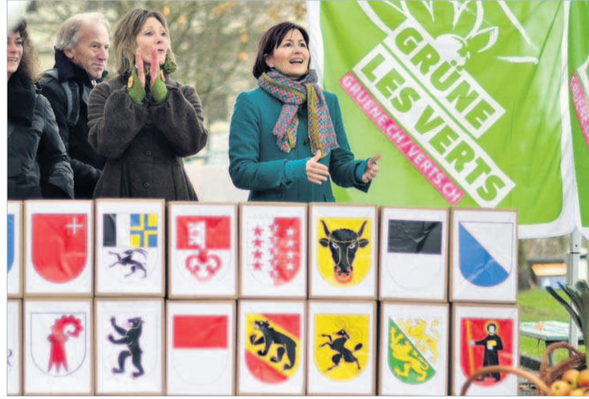
Regula Rytz bei der Einreichung der Fair-Food-Initiative im November 2015. www.fair-food.ch

Für mehr Qualität auf dem Teller Der sorglose Umgang mit Lebensmitteln und Rohstoffen zeigt, dass sich viele Menschen nicht bewusst sind, wie viel Wasser, Energie und Umweltzerstörung in unseren Alltagsprodukten stecken. Mit der «Fair-Food»-Initiative wollen die Grünen das Problem an der Wurzel packen. Die nationale Volksinitiative hat vier Verbesserungen zum Ziel: Nachhaltig produzierte Lebensmittel: Produkte aus bäuerlicher Landwirtschaft,