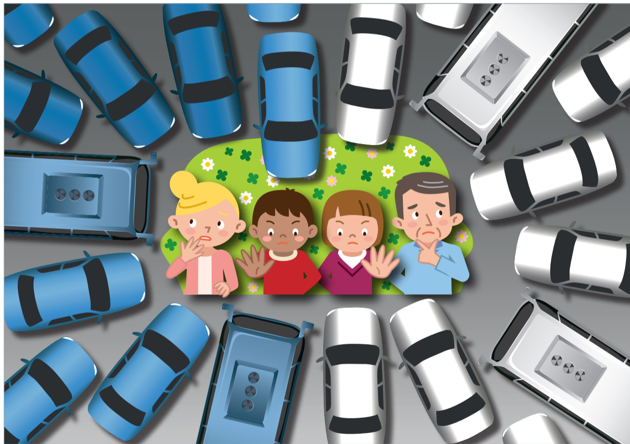
Der Mehrverkehr in den Quartieren zerstört den Lebensraum der BewohnerInnen.

«Das Carproblem am Löwenplatz bleibt auch mit dem Parkhaus Musegg bestehen»