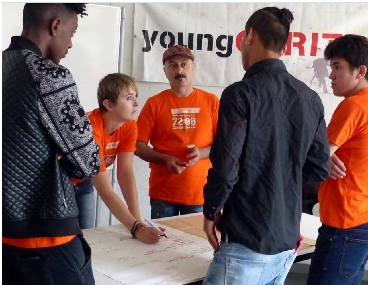
Bewohner des Asylzentrums Hirschkamp im Gespräch mit Engagierten der Aktion 72-Stunden.

Schon bevor das Asylzentrum Hirschkamp eröffnet wurde, haben sich die Bewohnerinnen und Bewohner des St. Karliquartiers wohlwollend auf die neuen Gäste eingestellt. Gezeigt hat sich dies sehr eindrücklich an der Informationsveranstaltung des Kantons im Pfarreizentrum St. Karl. Nun gehören die mehr als 100 Asylbewerber und Flüchtlinge genauso zum Quartierbild wie die Menschen aus 76 Na-