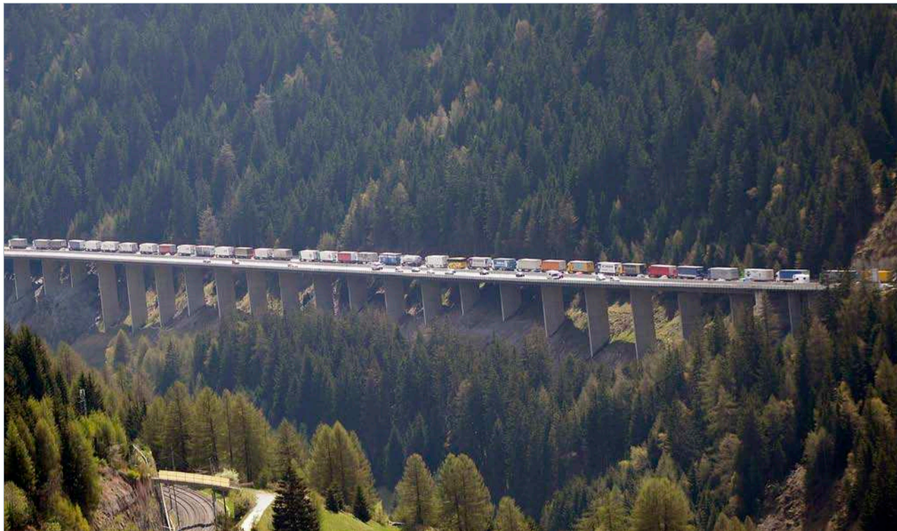
Der Brenner ist durchgehend vierspurig und erstickt in der Lastwagenlawine – er hat mehr als doppelt so viele Lastwagen pro Jahr zu verkraften wie der Gotthard.